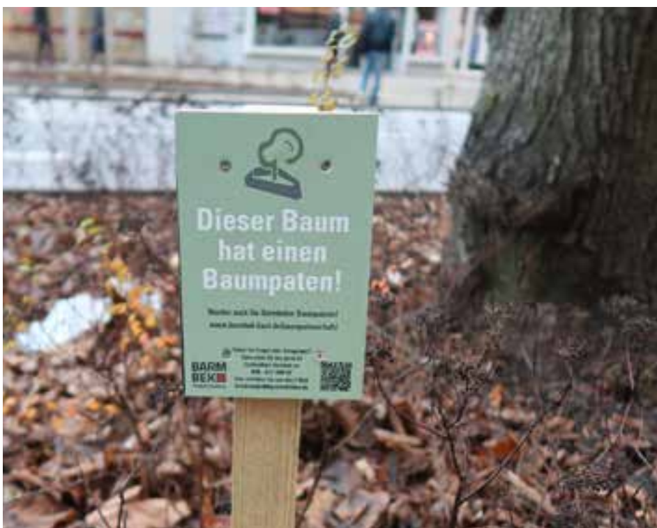
Abb. 09 - Baumpatenschaftsaktion

Weitere Infos und Anmeldung unter: www.barmbek-baut.de/baumpatenschaft