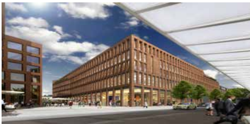
Abb. 01 - Fuhle 101 und Massaquoi-Passage (Blick vom Bahnhof)

Für den Neubau am Ex-Hertie-Standort wurde der Generalunternehmervertrag unterzeichnet, sodass im November 2017 die Rohbauarbeiten für den Hochbau beginnen konnten. Es ist geplant, das Gebäude bis Mitte 2019 fertigzustellen. Außerdem ist vor kurzem ein weiterer Mietvertrag mit einem Fitness-Studio abgeschlossen worden, dass große Flächen im 2.OG angemietet hat. Des Weiteren werden Peter Pane, Rewe, Aldi und Rossmann sowie ein IntercityHotel dort zu finden sein. Damit sind bereits mehr als 80 Prozent der zukünftigen Flächen des Geschäftshauses vermietet.