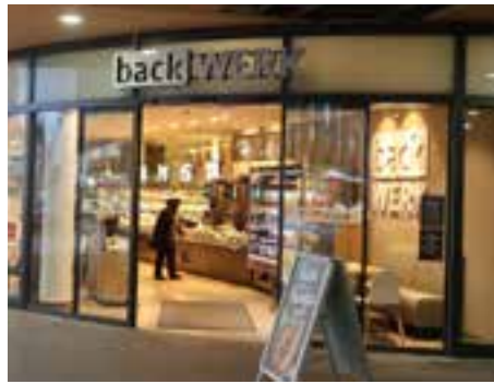
Abb. 02 - backWERK bezieht die Verkaufsfläche am Bahnhof

eine Filiale eröffnet. Außerdem liegt das Inspektionskonzept für die Deckenverkleidung vor, sodass mit einer zeitnahen Fertigstellung der Restarbeiten in der Halle zu rechnen ist. Darüber hinaus sind alle Aufzüge jetzt in Betrieb.