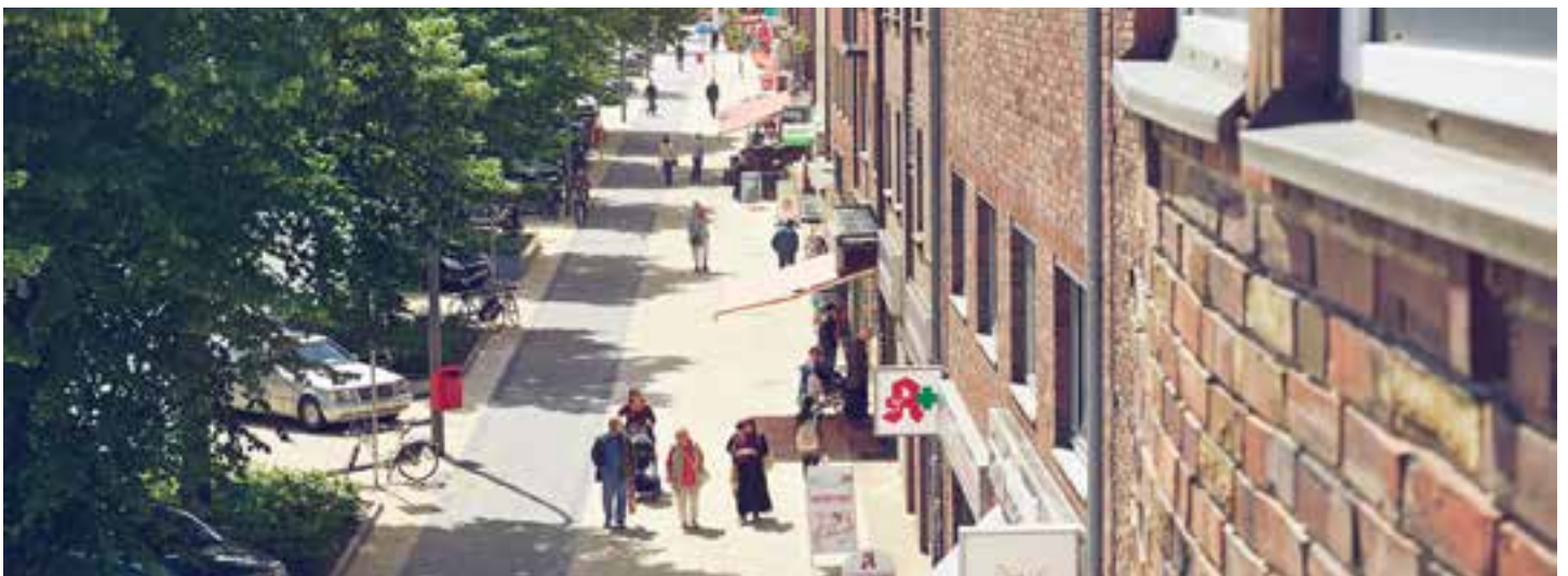
Abb. 06 - Nach den Baumaßnahmen lädt die Fuhlsbüttler Straße zum Flanieren ein

Seit 2005 wurden im Rahmen des Gebietsentwicklungsprozesses im Fördergebiet Barmbek-Nord zahlreiche unterschiedliche Projekte umgesetzt. Zum Ende des ursprünglich festgelegten Förderzeitraums im Jahr 2017 steht die Realisierung wesentlicher Maßnahmen, vor allem noch großer privater Projekte, aus. Unter anderem aus diesem Grund wurde eine Verlängerung der Förderlaufzeit für weitere drei Jahre bis Ende 2020 veranlasst, sodass in den kommenden Jahren weitere Projekte in der Realisierung begleitet werden können, die zum Ziel haben, das Zentrum Barmbek-Nords noch weiter zu stärken und qualifizieren.