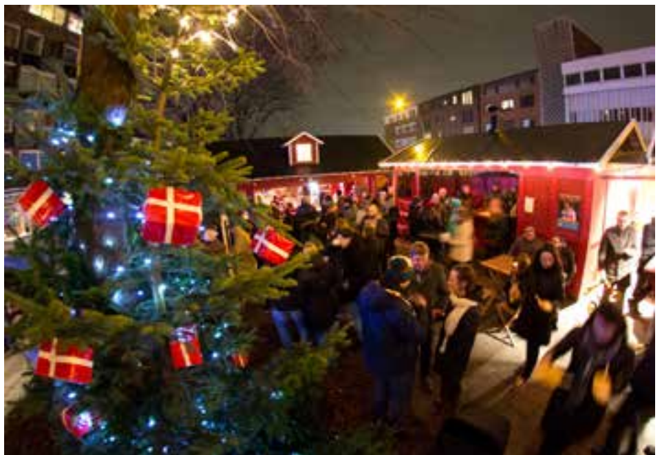
Abb. 03 - Weihnachtsmarkt in Barmbek auf der Piazzetta-Ralph-Giordano

In diesem Jahr verzaubert der Barmbeker Weihnachtsmarkt zum 6. Mal den Stadtteil. Zu finden ist dieser nun etwas weiter südlich als zuvor, auf der neu gestalteten Piazzetta-Ralph-Giordano, an der Fuhlsbüttler Straße in unmittelbarer Nähe zum Bahnhof Barmbek. Seit Ende November gibt es dort Glühweinspezialitäten, viele weihnachtliche Leckereien und ein buntes Kulturprogramm. Vor allem die Herzen der Kleinen schlagen bei einer Runde auf dem antiken Kinderkarussell höher. Bis einschliesslich 30. Dezember 2017 wird das hochweihnachtliche Hüttendorf geöffnet haben. Öffnungszeiten: Montag bis Samstag, jeweils 11.00 Uhr bis 21.00 Uhr sowie Sonntag, 12.00 Uhr bis 20.00 Uhr.